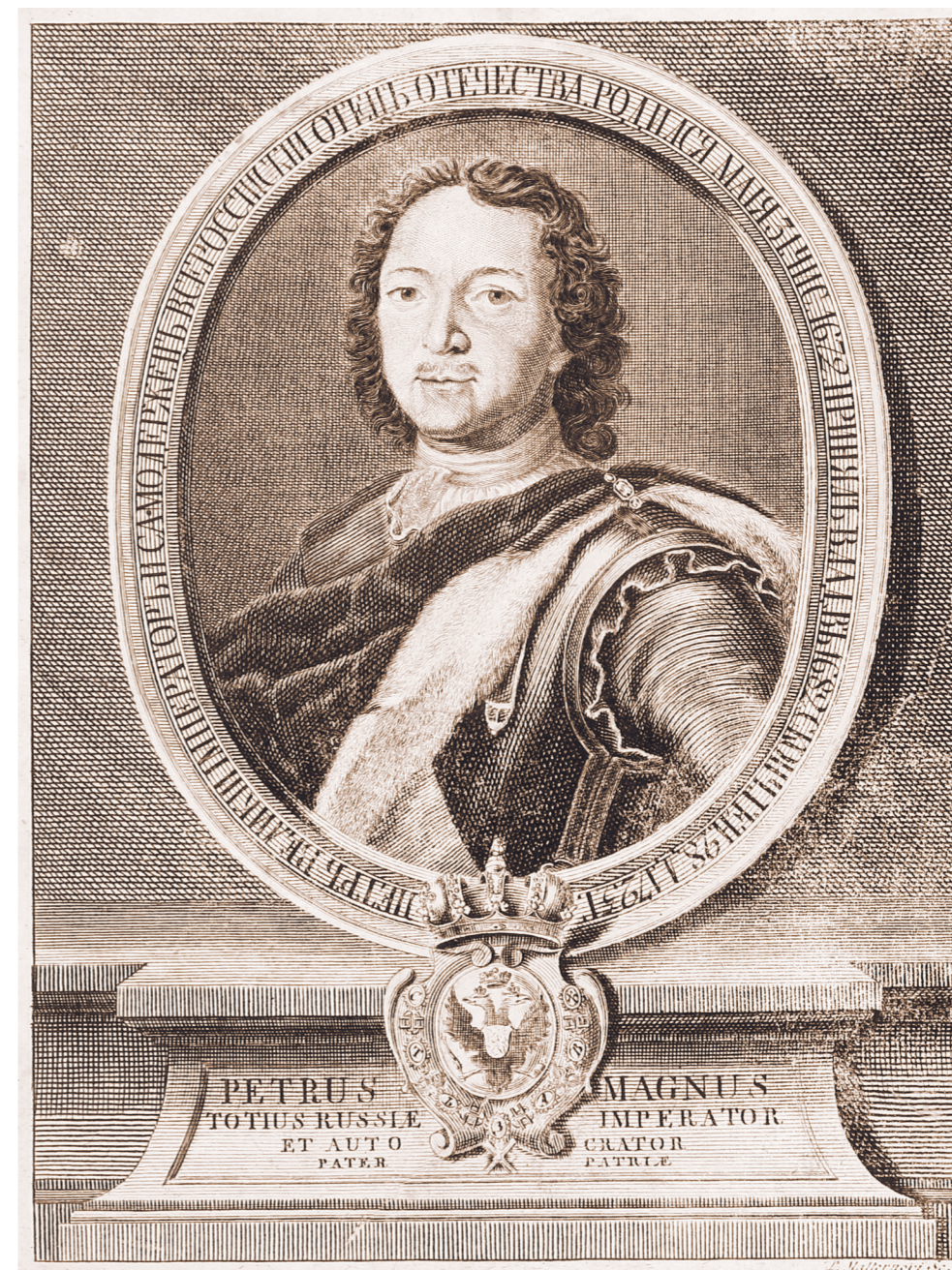
Ф. Маттарнови Портрет императора Петра I 1739 год Гравюра выполнена по оригиналу Л. Каравака