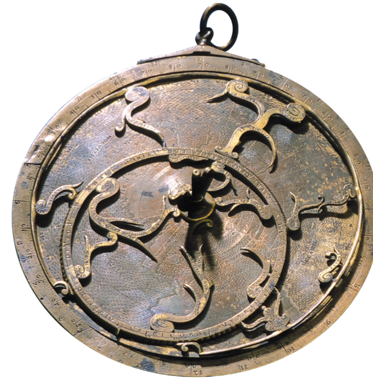
Корпус планисферной астролябии системы де Рохаса Из коллекций Козимо II Медичи (первого великого герцога Тосканы) и В. А. Тауберга (архитектора) Мастерская Хуана Баттиста Гисти. Италия, г. Флоренция 1562–1569 годы