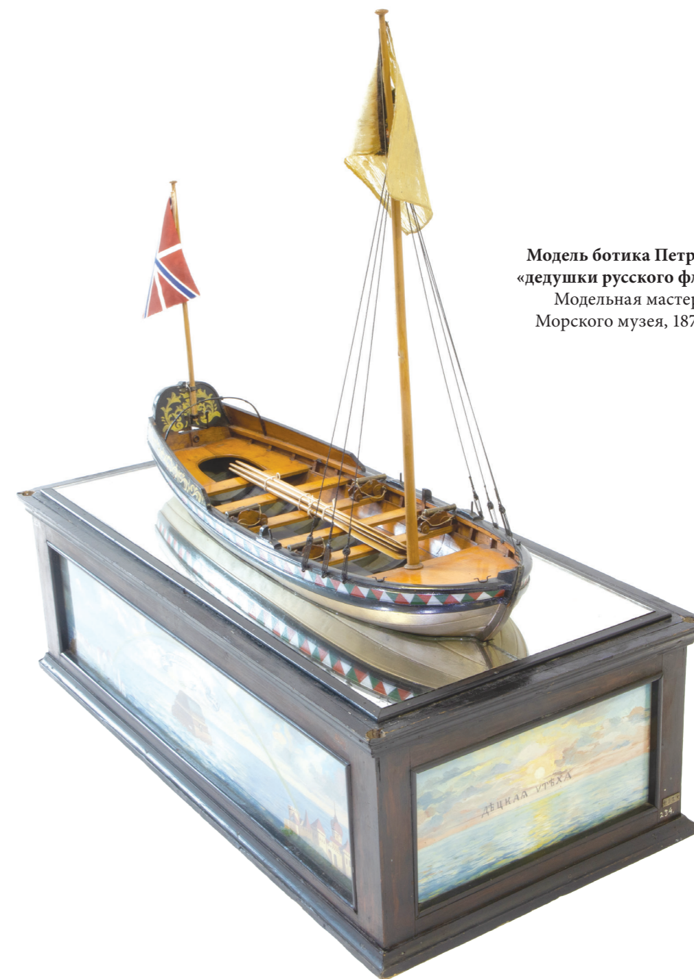
Модель ботика Петра I — «дедушки русского флота» Модельная мастерская Морского музея, 1872 год