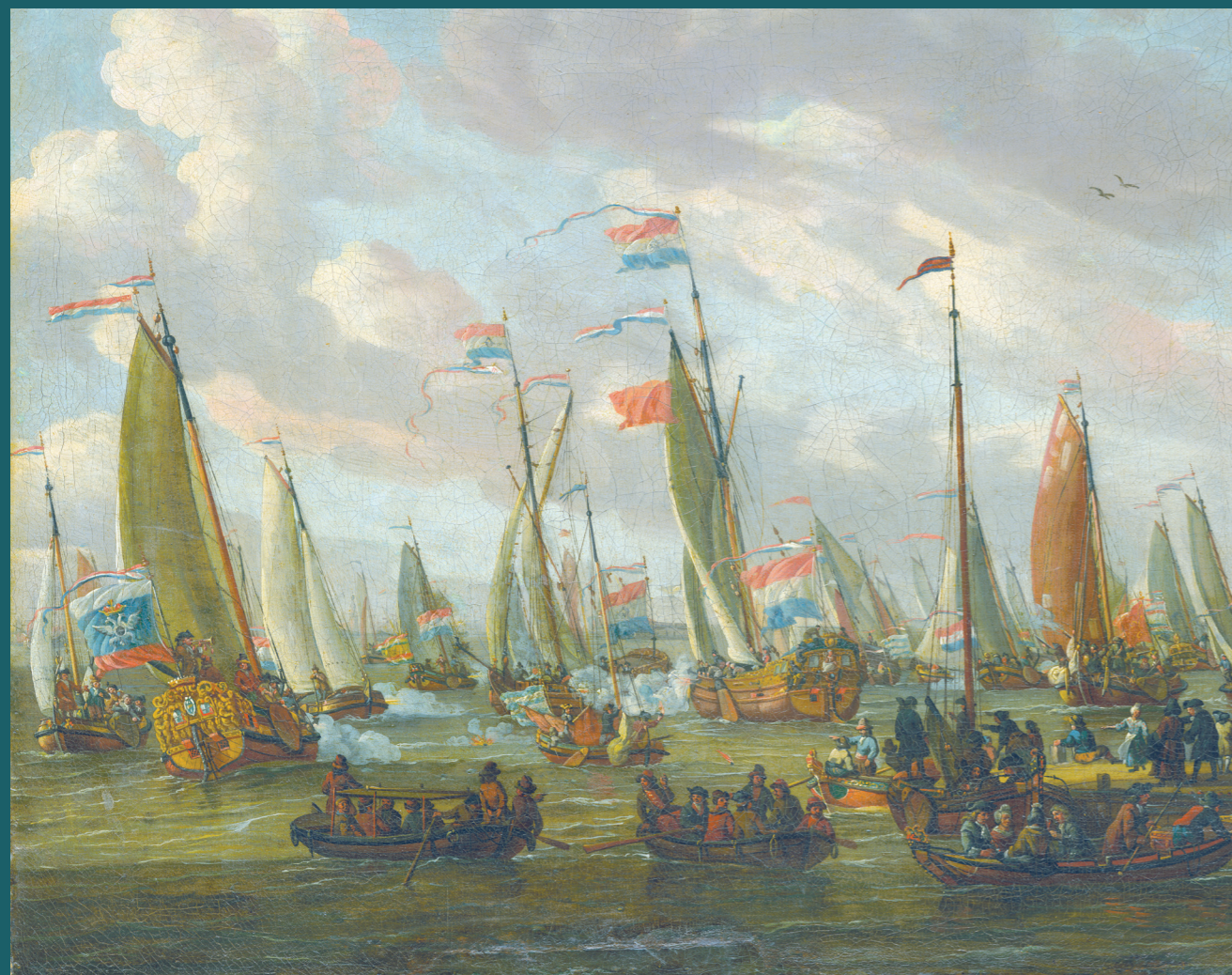
А. Сторк Посещение Петром I Голландии. Показательное сражение на реке Эй 1 сентября 1697 года Начало XVIII века