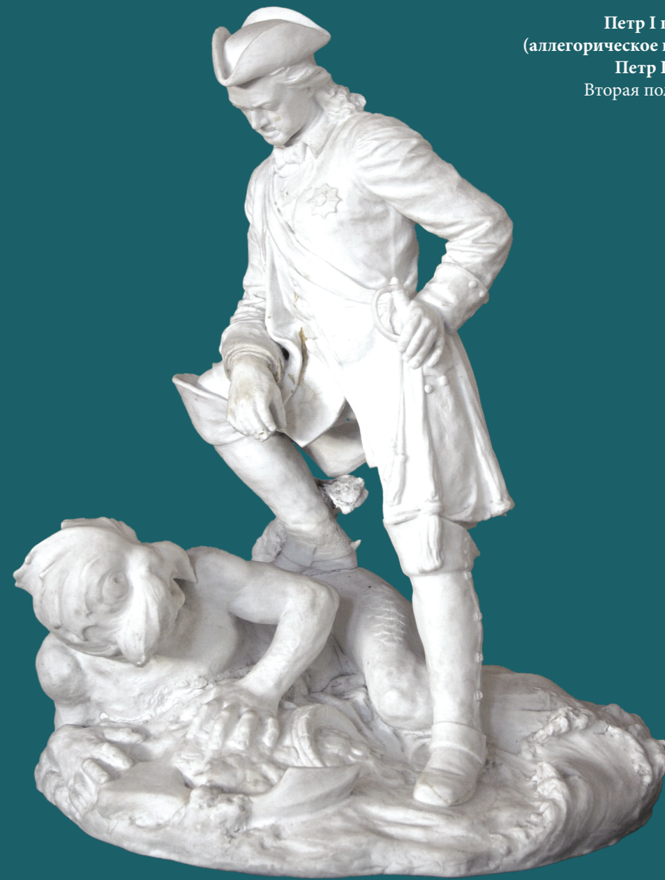
А. К. Тимус Петр I побеждает море (аллегорическое изображение — Петр I над Тритоном) Вторая половина XIX века