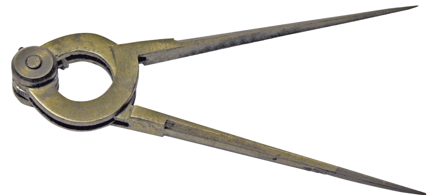
А. Шхонебек Осада Азова в 1696 году 1699 год