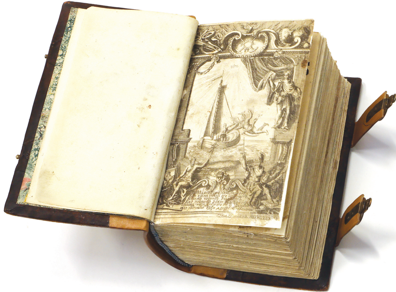
Книга «Устав морской о всем, что касается к доброму управлению в бытность флота на море». 1721 г.

Издание на русском и голландском языках. Морской устав Российской империи — изложение обязанностей всех чинов на судах военного флота. Был утвержден в качестве закона в январе 1720 года, издан в апреле 1721 года в Санкт-Петербургской типографии. Устав снабжен обширным предисловием, написанным самим Петром I при участии Феофана Прокоповича, в котором излагается история русского флота вплоть до 1719 года и подчеркивается значимость военного флота для России. Помимо обязанностей содержит приложение о сигналах. Устав был переиздан в 1724 году и до 1797 года служил основным руководящим документом для Военно-морского флота Российской империи.