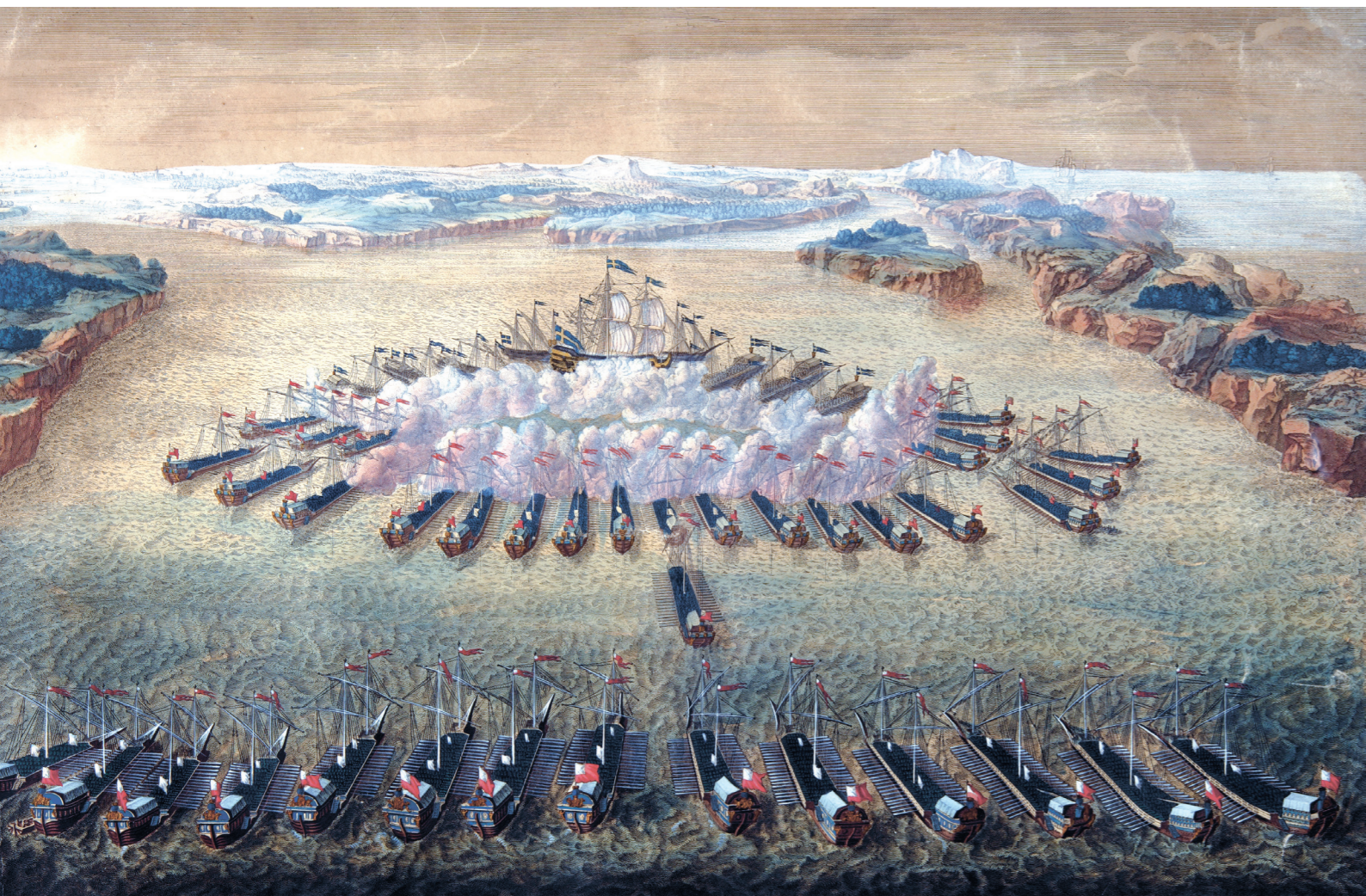
М. Бакуа Гангутское сражение 1714 год