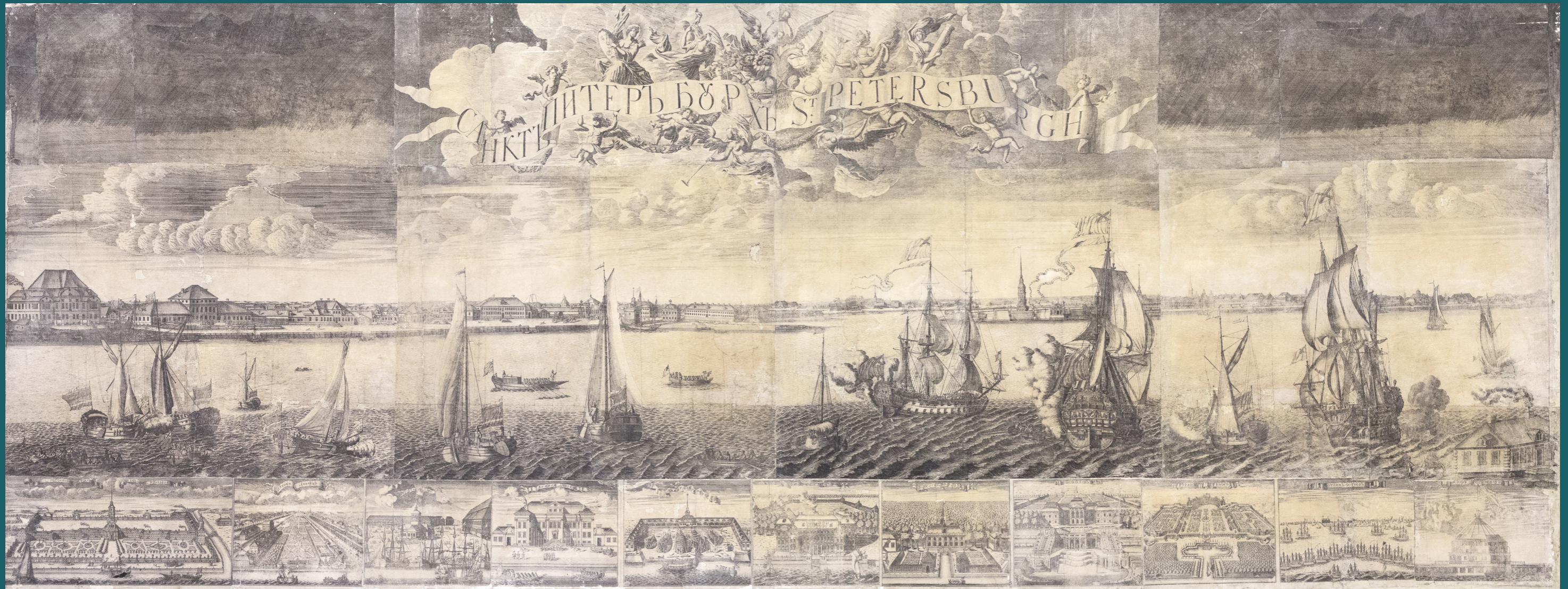
А. Ф. Зубов и граверы Санкт-Петербургской типографии Панорама Санкт-Петербурга 1716–1717 годы