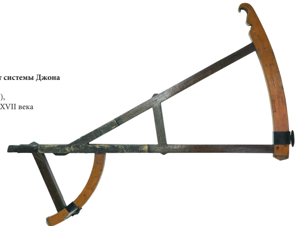
Квадрант системы Джона Дэвиса Англия (?), середина XVII века