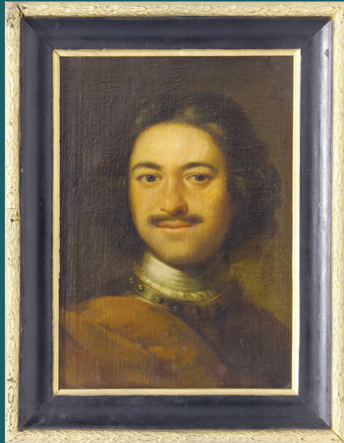
И. Н. Никитин Портрет Петра I Первая треть XVIII века

В зале рассказывается о периоде зарождения флота, когда в селе Измайлове в амбаре Лыняного двора Петр I нашел старый английский ботик, ставший символом Российского флота.