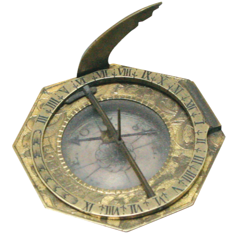
И. Г. Фоглер Универсальные равноденственные солнечные часы с компасом Германия. Первая четверть XVIII века