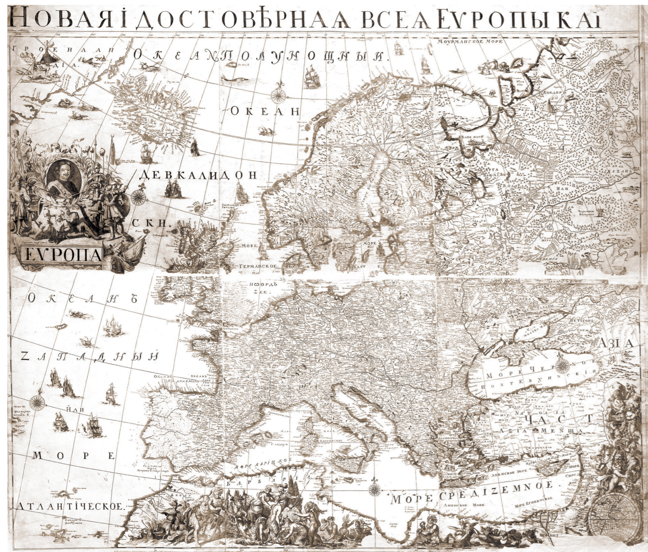
А. Ф. Зубов Карта Европы 1720-е годы