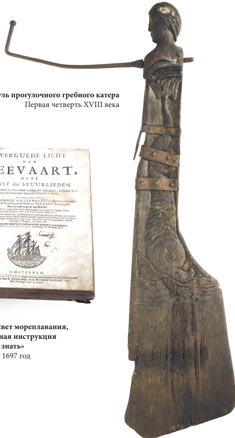
Руль прогудочного гребного катера Первая четверть XVIII века