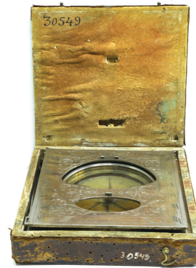
Часовой мастер Норт из Берлина Универсальные равноденственные солнечные часы Германия. Конец XVII века

Издание на русском и голландском языках. Морской устав Российской империи — изложение обязанностей всех чинов на судах военного флота. Был утвержден в качестве закона в январе 1720 года, издан в апреле 1721 года в Санкт-Петербургской типографии. Устав снабжен обширным предисловием, написанным самим Петром I при участии Феофана Прокоповича, в котором излагается история русского флота вплоть до 1719 года и подчеркивается значимость военного флота для России. Помимо обязанностей содержит приложение о сигналах. Устав был переиздан в 1724 году и до 1797 года служил основным руководящим документом для Военно-морского флота Российской империи.