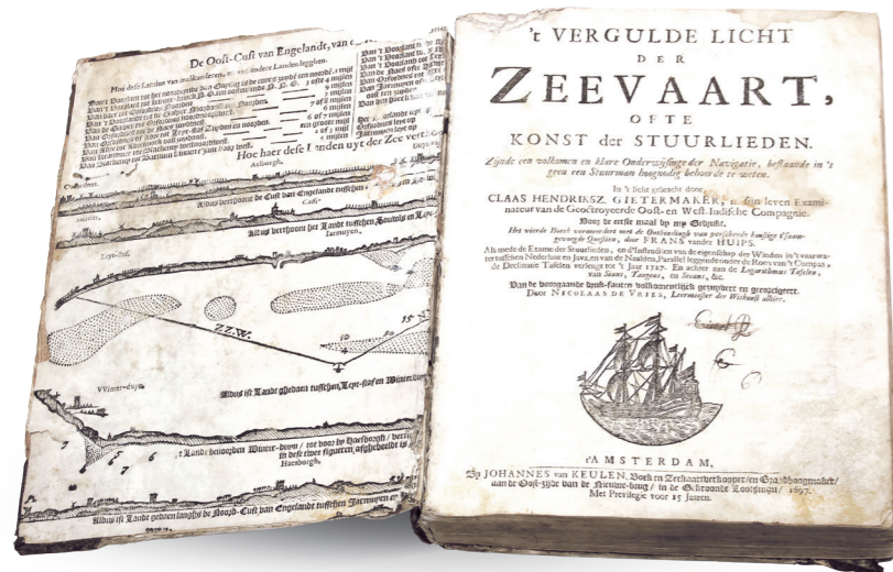
Титульный лист книги «Позолоченный свет мореплавания, или Искусство рулевых. Полная и понятная инструкция по навигации о том, что рулевой должен знать» К. Г. Гитермакер. Нидерланды, Амстердам, 1697 год