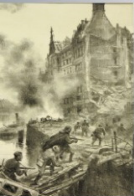
В. Богаткин. Бой на набережной. Советская пехота атакует укрепления в домах на набережной Шпрее 1945 г. Бумага

В Великую Отечественную советские художники продолжили традицию своих предшественников, изображая ее страшные реалии. 23 июня 1941 года все учреждения культуры были призваны органи-