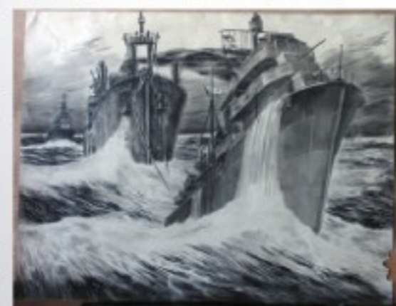
А. А. Меркулов. В боевом охранении 1941–1945 гг. Бумага, тушь

В Великую Отечественную советские художники продолжили традицию своих предшественников, изображая ее страшные реалии. 23 июня 1941 года все учреждения культуры были призваны органи-