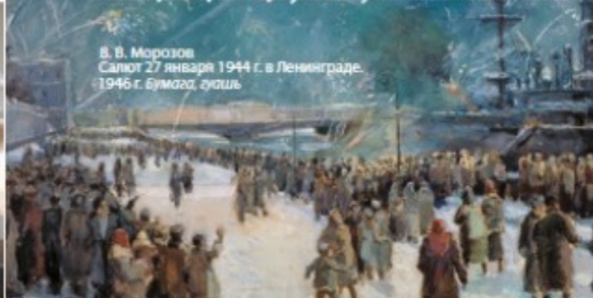
В. В. Морозов. Салют 27 января 1944 г. в Ленинграде. 1946 г. Бумага, гуашь

«Северная вахта», «Краснофлотец» и многих других; он оформлял сборник «Слава бесстрашным», альбом «Северный флот в боях за Родину», серию графических зарисовок «Дорога в Киркенес – Норвегию».