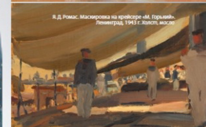
Я. Д. Ромас. Маскировка на крейсере «М. Горький», Ленинград, 1943 г. Холст, масло

Сегодня музей продолжает персонализацию памяти о Великой Отечественной войне, начатую акцией «Бессмертный полк». На выставке, посвященной 75-летию Победы, были представлены около 100 произведений графики из собрания Центрального военно-морского музея, многие из которых никогда еще не выставлялись для обозрения широкой публике.