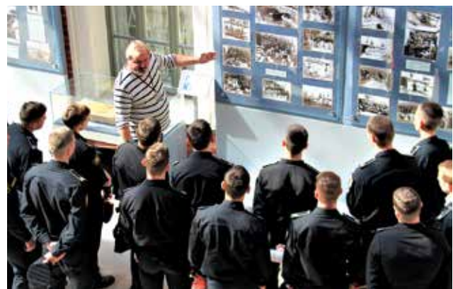
Часть экспозиции выставки «Тем, кто в тельняшке...», развернутая в атриуме Центрального военно-морского музея к 145-летию российской тельняшки

стала родной, — курсанты военно-морских учебных заведений. Филиал ЦВММ «Музей Балтийского флота» (г. Балтийск Калининградской обл.) совместно с Балтийской военно-морской базой подготовили праздник для гостей и жителей города. В филиале ЦВММ «Кронштадтская крепость» в честь Дня тельняшки были организованы мастер-классы: для малышей — «Создай свою тельняшку», для лиц постарше — «Семафорная азбука». Особенно многолюдно было в филиалах ЦВММ «Подводная лодка Д-2 "Народоволец"» и «Дорога жизни», где все желающие смогли узнать о подвигах моряков, прославивших российскую тельняшку.