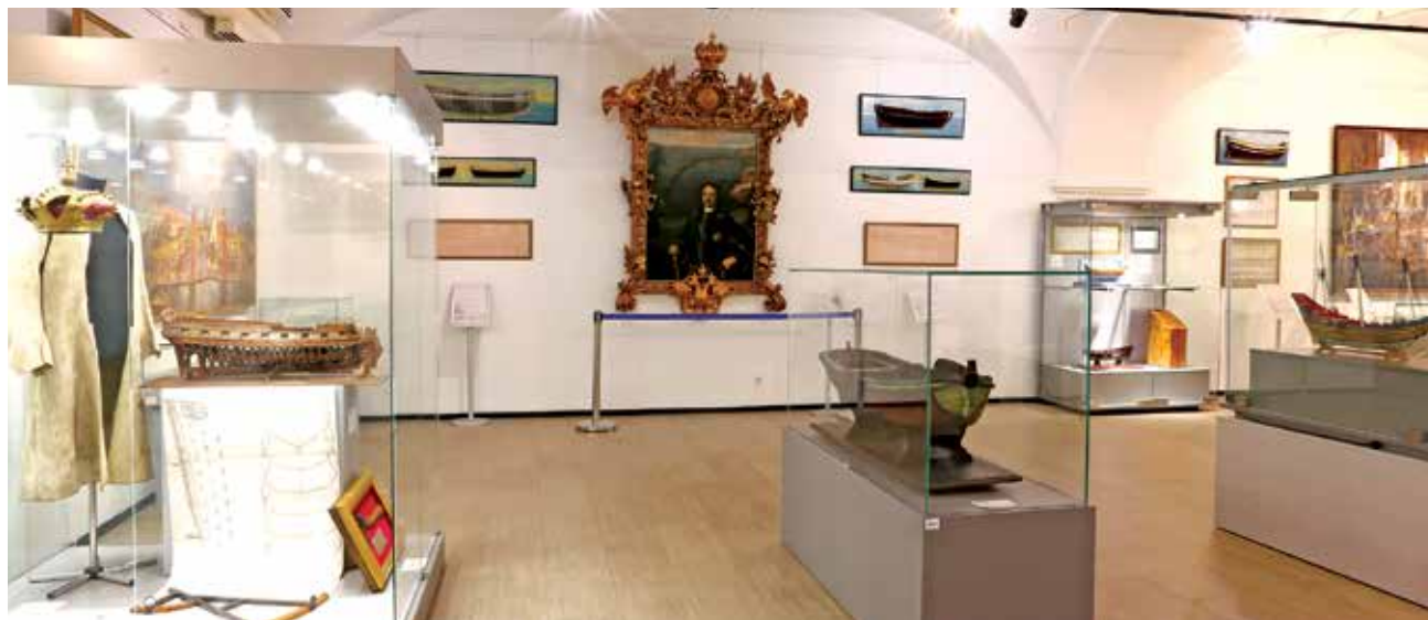
Один из залов выставки «Сокровищница Российского флота»

В день юбилейных торжеств гостям ЦВММ была представлена выставка «Сокровищница Российского флота», посвященная 310-летию Центрального военно-морского музея. В ее экспозиции разместились жемчужины музейного собрания. История ЦВММ была показана как процесс формирования музейных коллекций, сделавших его национальным морским музеем России, хранителем традиций и боевой славы отечественного флота. Хронологические рамки выставки охватывают историю собрания ЦВММ от первых «половинчатых моделей» эпохи Петра I до последних наиболее ценных поступлений. На выставке экспонировался прижизненный портрет Петра I работы Л. Караваччи в недавно отреставрированной уникальной барочной раме XVIII века. Отдельный раздел выставки был посвящен творчеству сотрудников мастерской художников-маринистов ЦВММ, работающей с 1952 года. Эта выставка стала первым с момента открытия музея в 2013 году событием, когда столь масштабно, во всех шести залах выставочного комплекса ЦВММ была создана временная экспозиция, посвященная одной теме.