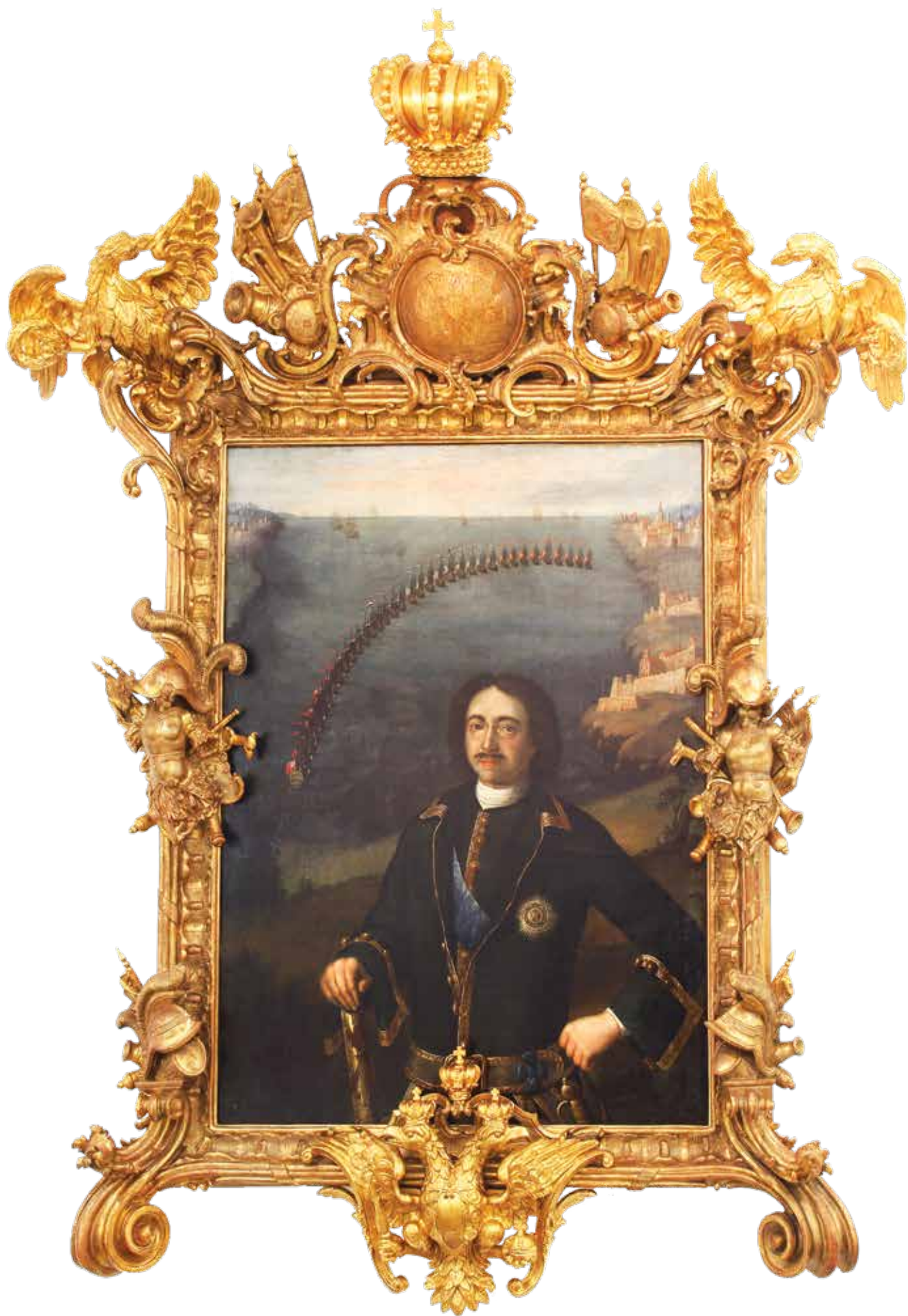
Л. Каравак. Портрет Петра I. 1720-е