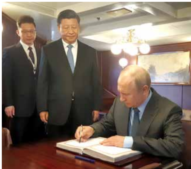
Президент Российской Федерации Владимир Путин делает запись в книге почетных посетителей филиала ЦВММ на крейсере «Аврора». 6 июня 2019 г.

1918–1920 годов в России и участию Рабоче-Крестьянского Красного флота в отражении иностранной интервенции. В ее работе приняли участие историки, специалисты по истории флота и судостроения, сотрудники музеев, архивов и библиотек, преподаватели учебных заведений, курсанты, студенты и аспиранты, коллекционеры.