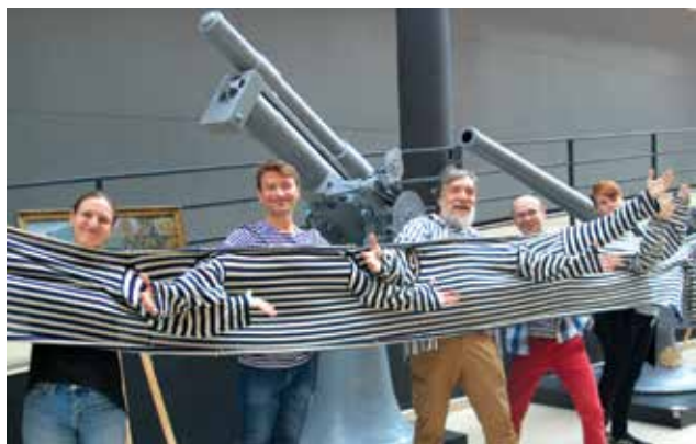
День знаний в тельняшке. 1 сентября 2019 г.

1 сентября Центральный военно-морской музей преподнес детям, их родителям и всем любителям морской романтики прекрасный праздник, пригласив отметить его как День знаний в тельняшке. Этот день в музее начался с детской интерактивной программы «Полосатый рейс» с участием аниматоров. Почетный гость праздника — лидер петербургского творческого