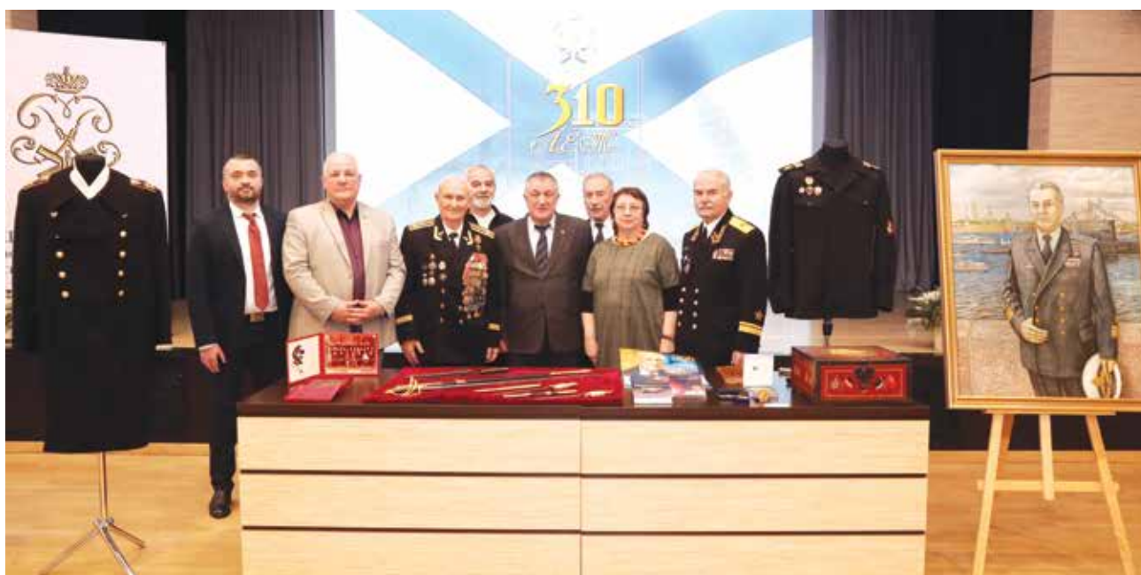
День дарителя в Центральном военно-морском музее

24 января 2019 года полуденный выстрел в Петропавловской крепости прозвучал в честь 310-го дня рождения Центрального военно-морского музея. Затем представители руководства музея возложили цветы к могиле его основателя — Петра Великого. Праздник продолжил торжественный вечер с театрализованным