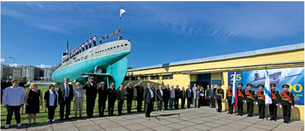
Торжественная церемония, посвященная 90-летию подводной лодки Д-2 и 25-летию со дня открытия музея «Подводная лодка Д-2 "Народоволец"»

"Народоволец"» прошли торжественные мероприятия, посвященные двойному юбилею: 90-летию со дня спуска подводной лодки на воду (19 мая 1929 года) и 25-летию со дня открытия в ней музея (2 сентября 1994 года). Первенец советского подводного кораблестроения до сих пор в строю. В начале 2018 года филиал принял миллионного посетителя.