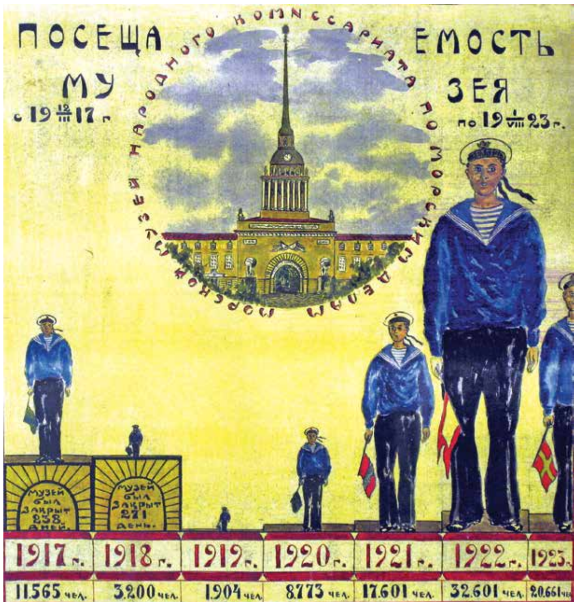
Диаграмма поступлений музейных коллекций. 1923