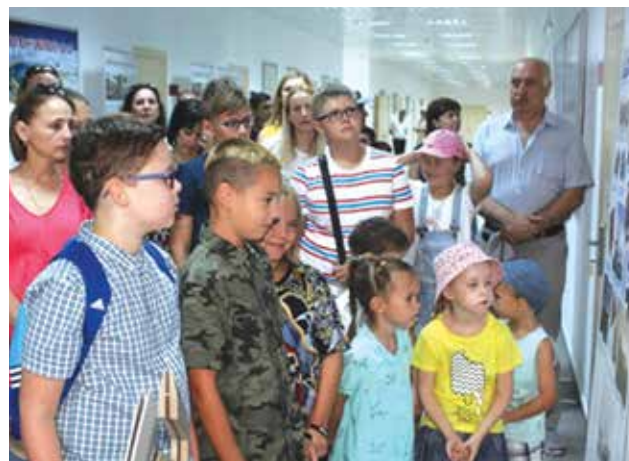
Передвижная выставка «Три века Военно-Морского Флота России», развернутая ЦВММ в посольстве России в городе Баку (Азербайджанская Республика)

3–17 августа в рамках V Армейских международных игр «АрМИ-2019» Центральный военно-морской музей развернул в парке «Патриот» (Московская область) временную выставку, посвященную 75-летию Победы в Великой Отечественной войне. Передвижные выставки музея на тему «Три века Военно-Морского Флота России» были открыты в Иране, на острове Киш, и в Азербайджане — в пункте базирования кораблей ВМС Азербайджанской Республики и посольстве России в городе Баку.