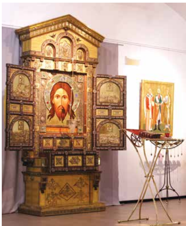
Один из залов выставки «Небесные покровители Российской армии и флота», на которой была представлена копия киота для Главного храма Вооруженных Сил РФ с иконой «Спас Нерукотворный»

1 сентября Центральный военно-морской музей преподнес детям, их родителям и всем любителям морской романтики прекрасный праздник, пригласив отметить его как День знаний в тельняшке. Этот день в музее начался с детской интерактивной программы «Полосатый рейс» с участием аниматоров. Почетный гость праздника — лидер петербургского творческого