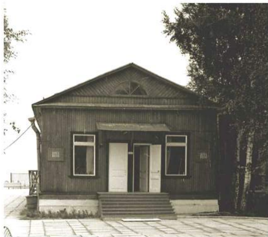
Здание филиала ЦВММ

Филиал Центрального военно-морского музея «Дорога жизни», расположенный в поселке Осиновец Всеволожского района Ленинградской области, был создан на основании приказа Главнокомандующего Военно-Морским Флотом № 443 от 14 ноября 1968 г. Он открыл свои двери для посетителей 12 сентября 1972 г. Здание музея находится у берега Ладоги, недалеко от мыса Осиновец, откуда начиналась легендарная «Дорога жизни». Музей посвящен беспримерному подвигу защитников блокадного Ленинграда, воинов Ленинградского и Волховского фронтов, моряков Ладожской военной флотилии,