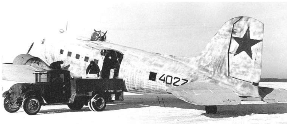
Разгрузка военно-транспортного самолета Ли-2 на аэродроме