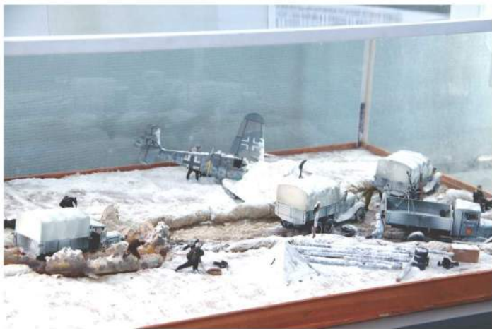
Макет во 2-ом зале

Экспонаты второго зала рассказывают о ледовой трассе 1941–1942 г. С началом ледостава на Ладожском озере водные перевозки прекратились. Для обеспечения города продовольствием и боеприпасами оставался один путь — по льду озера. Санногужевые обозы двинулись в путь 20 ноября 1941 г., на следующий день прошла первая автомашина. Так появилась Военно-автомобильная дорога № 101 (ВАД-101) протяженностью 29 километров, проходившая по трассе мыс Осиновец — острова Зеленцы — село Кобона. Зимняя дорога располагалась всего в 20–25 километрах от берега, занятого противником. Вражеские самолеты почти ежедневно проводили жестокие налеты