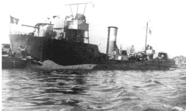
Сторожевой корабль «Конструктор»

Ладожской военной флотилии Краснознаменного Балтийского флота. 4 ноября 1941 года был тяжело поврежден в районе Осиновца после ударов авиации противника. Был поднят, восстановлен и 13 апреля 1943 г. в качестве канонерской лодки вновь введен в строй.