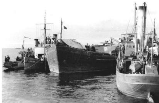
Корабли флотилии на рейде