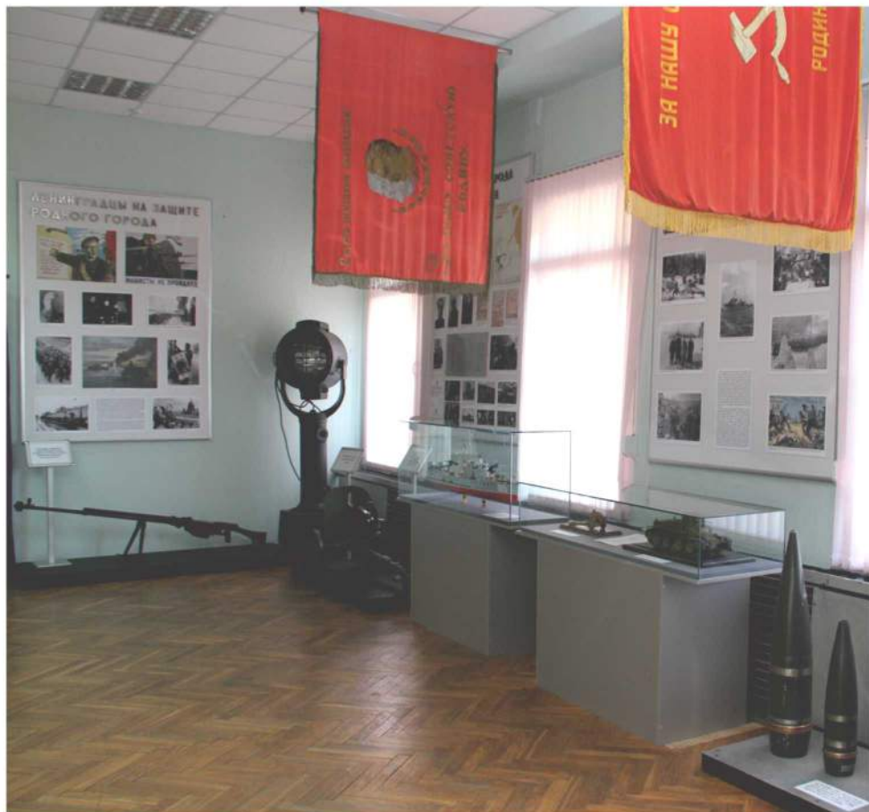
Интерьер 1-го зала (экспонаты)

Экспозиция зала № 1 рассказывает о первых месяцах войны советского народа против немецко-фашистских захватчиков, начале блокады Ленинграда и создании Ладожской военной коммуникации. Здесь представлены документы, повествующие о том, как гитлеровская Германия вероломно нарушила договор о ненападении и обрушилась всей своей мощью на Советский Союз, плакаты военного времени, фотографии руководителей и героев обороны Ленинграда, модель сторожевого катера МО-201 и его боевой флаг, снаряды корабельных орудий, минометная установка, 45-мм орудие, пулеметы.