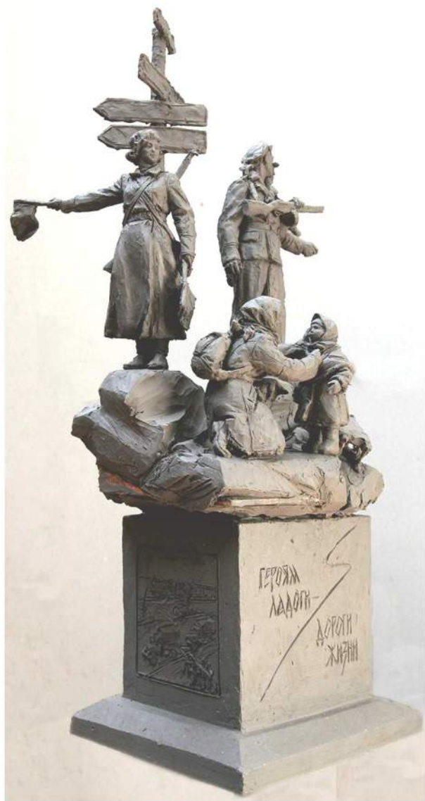
Скульптурный эскиз памятника в филиале ЦВММ «Дорога жизни»

На берегу Ладожского озера предполагается установить монумент в честь защитников «Дороги жизни», проект которого создается в Студии военных художников имени М. Б. Грекова при участии специалистов Центрального военно-морского музея.