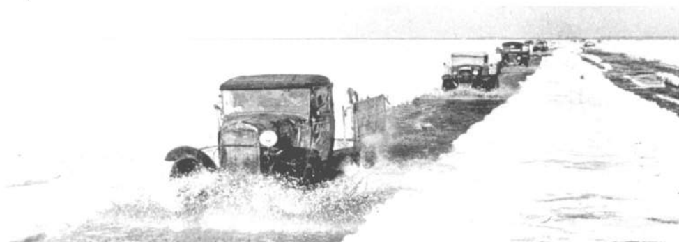
ЗИС-5 на «Дороге жизни»

В навигационный период перевозки на «Дороге жизни» осуществлялись судами Северо-Западного речного пароходства в охранении боевых кораблей Ладожской военной флотилии. Воздушный мост над Ладогой осуществляли в основном транспортные самолеты Ли-2.