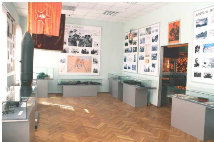
Интерьер 4-го зала