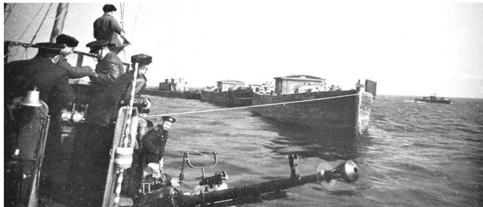
Караван с продовольствием