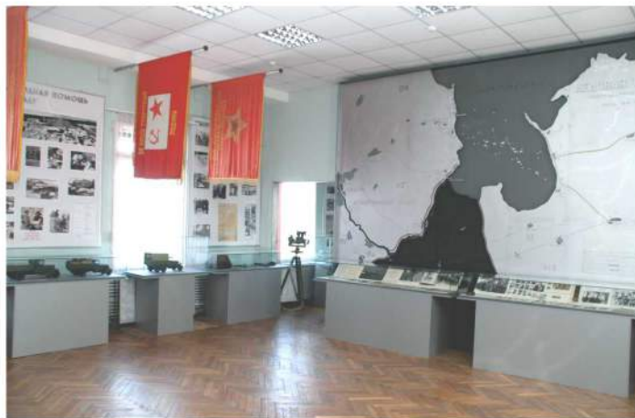
Интерьер 2-го зала