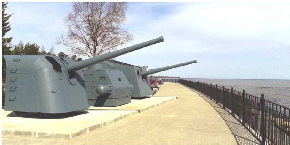
Корабельное вооружение на набережной