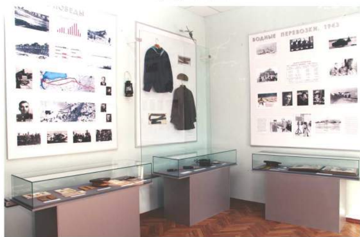
Экспозиционные комплексы в 4-м зале

Зал № 4 повествует о работе ледовой трассы зимой 1942/43 г. В это время Ладожская трасса, которую ленинградцы называли «Дорогой жизни», перестала быть единственной артерией, питающей город. 12 января 1943 г. началась операция «Искра» — в наступление перешли войска Ленинградского и Волховского фронтов. Их боевые действия поддерживались огнем корабельных орудий и ударами авиации Краснознаменного Балтийского флота. После ожесточенных боев части Красной Армии преодолели мощные укрепленные районы противника южнее Ладожского озера. 18 января произошла встреча воинов двух фронтов, ленинградцы услышали по радио долгожданную весть: «Блокада прорвана!» По освобожденной от захватчиков земле была проложена железнодорожная ветка со свайно-ледовой переправой через реку Неву. В экспозиции представлены карта-схема железнодорожной линии Шлиссельбург–Поляны, модель свайного моста через Неву, контрольно-измерительные приборы строителей.