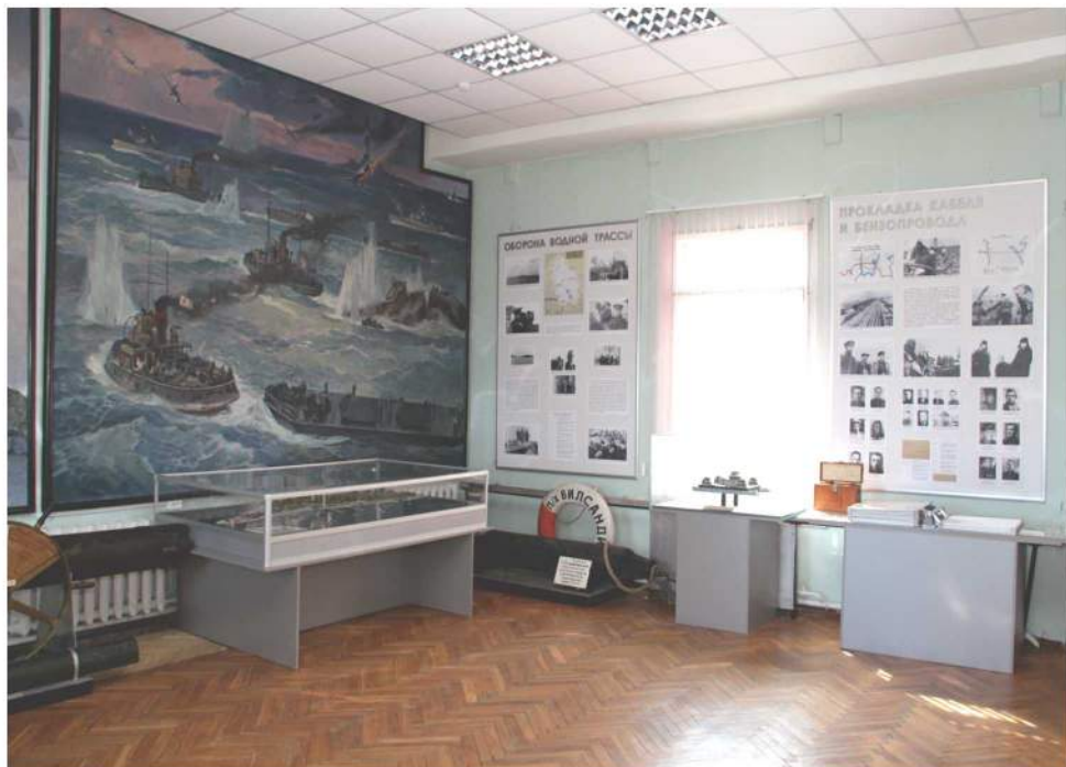
Интерьер 3-го зала

Зал № 3 рассказывает о навигации 1942 г. и действиях Ладожской флотилии. Не достигнув желаемых результатов авиационными ударами, противник создал на Ладоге военную флотилию. 22 октября 1942 г. ее корабли попытались высадить десант на остров Сухо. Но в результате решительных действий гарнизона острова, советской авиации и кораблей Ладожской военной флотилии атаки врага были отбиты с большими для противника потерями. Больше вражеская флотилия активных действий не предпринимала.