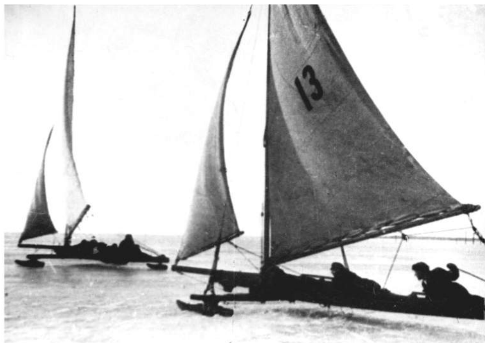
Буера на ладожском льду